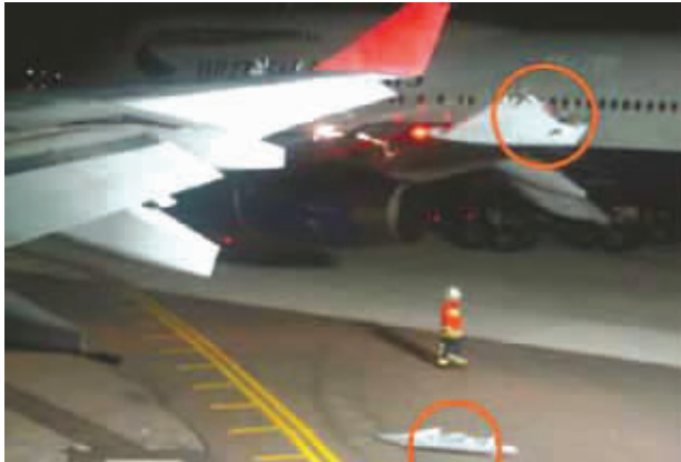
英国航空公司的747客机的左侧机翼尖被撞受损,而地上掉落的就是斯里兰卡航空公司空客A340客机的机翼尖。

据《现代快报》消息 飞机的任何一点损伤都可能在飞行途中造成致命事故,而斯里兰卡航空公司的一架空中客车A340飞机日前在机翼尖被撞掉的情况下,依然坚持要载客飞行,这让机上的乘客非常担心,有几人干脆搬下行李拒绝搭机。